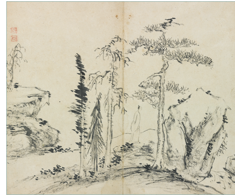
김정희, <고사소요> 종이에 먹, 29.7×24.9cm, 간송미술관

한 명의 선비가 뒷짐을 쥐고 한적한 숲속의 오솔길을 거닐고 있다. 이목구비를 그리지 않아 세세한 표정까지 살필 수는 없지만, 무언가를 골똘히 생각하며 사색에 잠겨 있는 모습이다. 단정히 갈무리한 머리와 정갈한 옷매무세에서 선비의 정결하고 고고한 삶과 정신이 읽혀진다. 길가 좌우에 자리한 소나무와 전나무, 바위도 선비를 닮아 청수(淸秀)하다. 어느 한곳도 속되거나 잡스럽지 않다. 기교나 과장도 없다. 그래서 건조하고 단순해 보일 수도 있다. 그러나 이것이 바로 추사가 추구하고